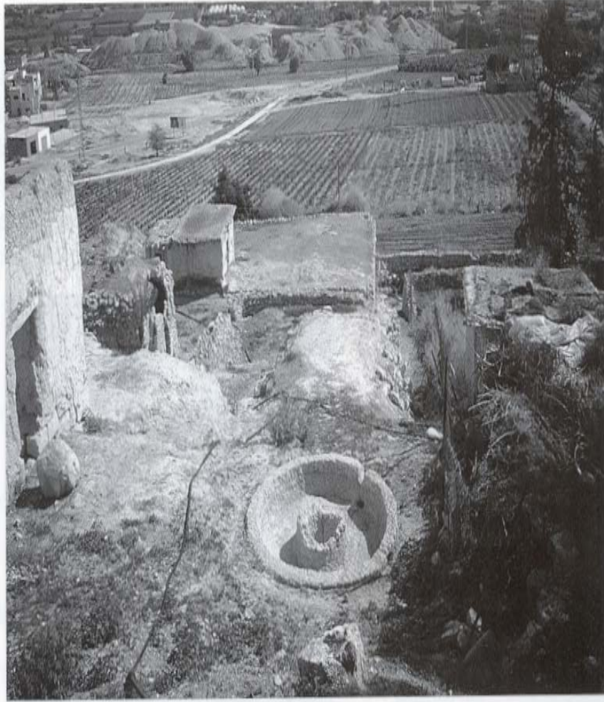
صورة طاحونة السكر قرب أريحا

Taha, Hamdan, Die Ausgrabungen von Tawahin es-Sukkar im Jordan-Tal, Z.D.P.V., 120, 2004, Tafel 2.