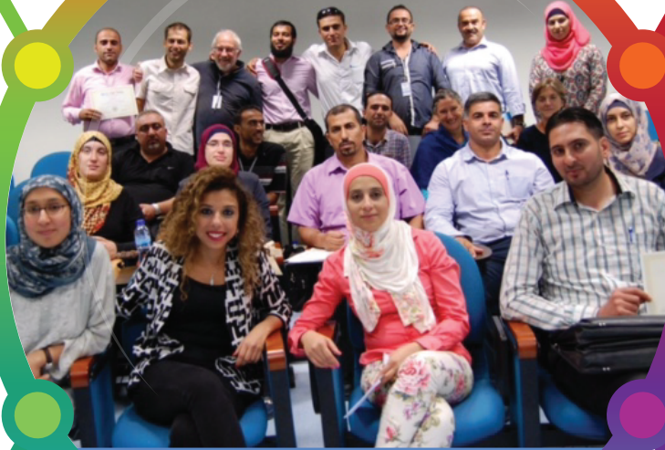
ورشة عمل طب الاسرة

نظمت كلية الطب و علوم الصحة ورشة عمل لتطوير برنامج الإختصاص العالي لطب الاسرة في فلسطين بدعم من المجلس البريطاني British Council و مؤسسة Med- Aid for Palestinian وتعد هذه الورشة الثانية لتطوير برنامج الاختصاص لطب الاسرة في فلسطين و التي تتكون من ٢٠ طبيباً بالاضافة الى كادر طب الاسرة و المجتمع و ٩ أكاديميين متطوعين من جامعات بريطانية و أوروبية.